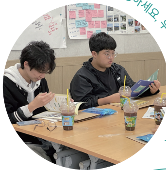
안녕하세요, 우리는 도담 서포터즈입니다!

이 첫 만남은 결과를 정하는 자리가 아니라, 함께 고민하고 결정하는 경험을 쌓는 시간이었습니다. 도담 서포터즈는 이 시간을 통해 각자의 강점을 바탕으로 역할을 찾기 시작하였으며, 단오맞이 청소년 가요제를 향한 첫 걸음을 도담도담 내딛었습니다.