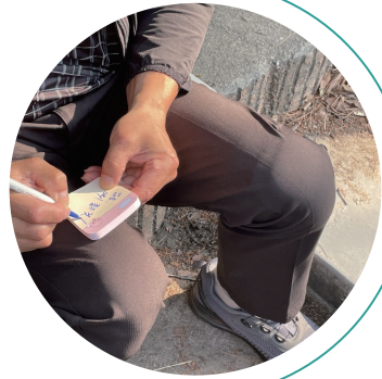
안녕하세요, 우리는 도담 서포터즈입니다!

지역주민 소감을 받는 과정에서는 거절을 경험하기도 했지만, 이를 실패가 아닌 배움의 과정으로 받아들이며 다시 도전하는 모습이 나타났습니다. 청소년들은 처음의 머뭇거림을 지나 점차 눈을 맞추고 먼저 다가가 인사를 건네는 주체로 변화하였으며, 활동이 진행될수록 자신감 있는 표정과 말투로 현장을 누볐습니다. 특히 공연 직후의 긴장된 참가자들에게 공감과 응원의 말을 전하며 자연스럽게 소감을 이끌어내는 모습에서는 책임감 있게 자신의 역할을 해내고 지역주민과 관계 맺기의 성장이 드러났습니다.