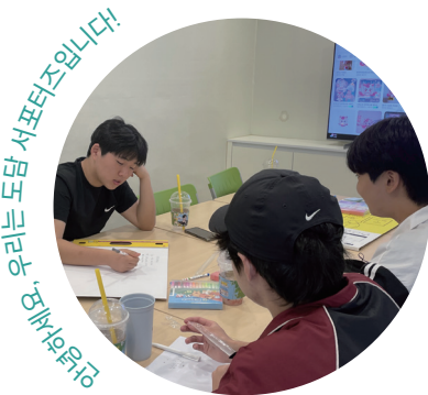
안녕하세요, 우리는 도담 서포터즈입니다.

앞선 회기에서 도담 서포터즈는 서로의 강점을 알아가고, 단오맞이 청소년 가요제를 위해 어떤 활동을 준비할지 함께 고민하였습니다. 이번 회기는 그 논의를 바탕으로 1차 예선을 실제로 어떻게 운영할 것인지 구체화하는 시간으로 이어졌습니다. 담당자는 가요제 전체 일정을 다시 공유하며, 이번 회기에서 결정하고 준비해야 할 내용을 안내하였습니다. 대부분의 논의를 이날 마무리할 수 있을 것이라는 의견이 있었으나, 활동을 더 준비하고 싶다는 참여자들의 아쉬움도 함께 전해졌습니다. 이에 담당자는 추가 준비물 구입 시 다시 만나는 방안을 제안하며 다음 논의를 이어갈 수 있도록 하였습니다.