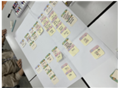
지역사회 복지 이슈는 무엇일까?