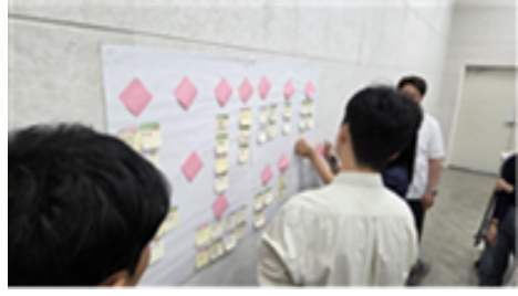
구성원이 생각하는 우리 복지관은?